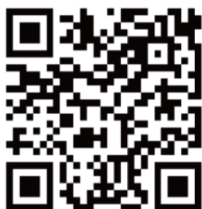
全民健保行動快易通APP

1. 掃描下列QR-Code或在google play store搜尋「【全民健保行動快易通 | 健康存摺APP】」，執行APP下載